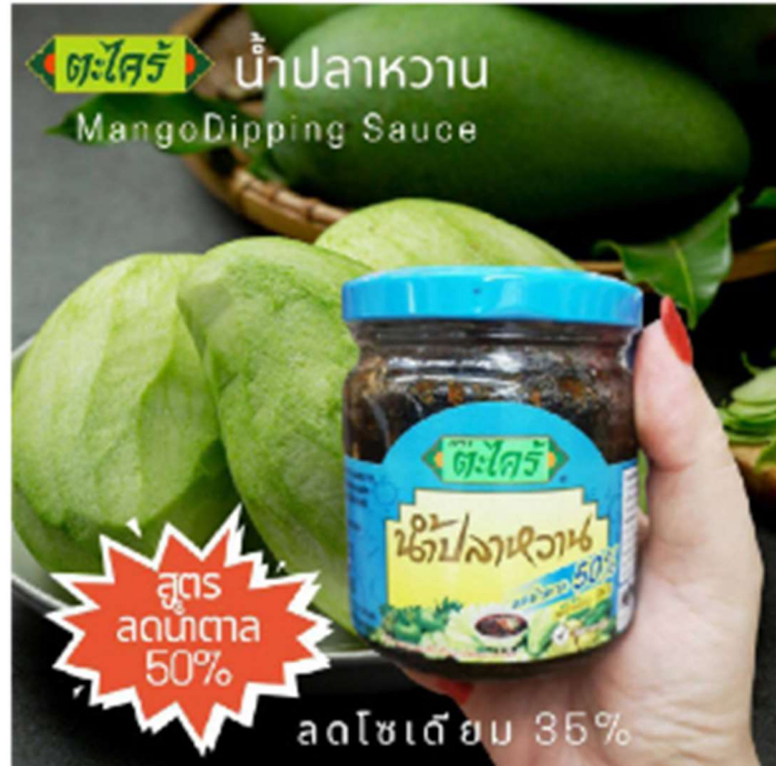
ผลิตภัณฑ์น้ำปลาหวานสูตร Low sodium

ผลจากการจัดกิจกรรม CMC Innovation Award การประกวดผลงานนวัตกรรมที่ผ่านมา มีผลงานนวัตกรรมที่ได้รับการจดทะเบียนสิทธิบัตรและอนุสิทธิบัตร จำนวน 2 ผลงาน ดังนี้